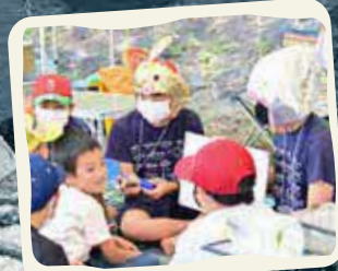
生き物のおはなし